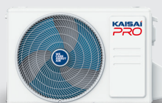
Jednostka zewnętrzna KRP