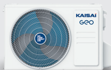
Jednostka zewnętrzna KGE